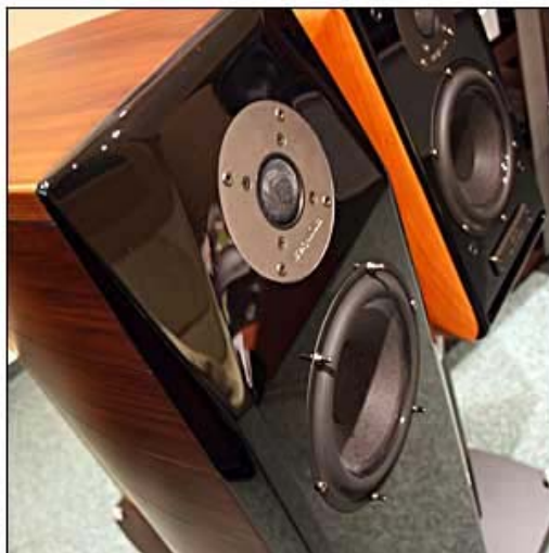
Černé čelo s vysokým leskem je bezchybné - na Taiwanu se naučili dosáhnout evropské úrovně kvality. Středobasový reproduktor je dle slov zástupce Usher „Stihající, ale přeci jen o úroveň níž...“ než výškáč. Je to tak...